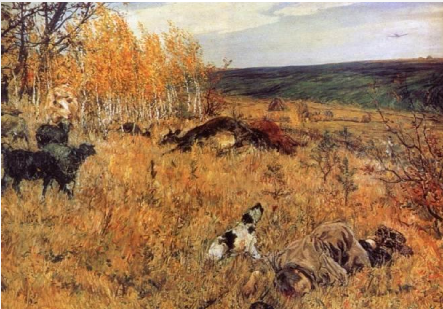
А. Пластов «Фашист пролетел» 1942