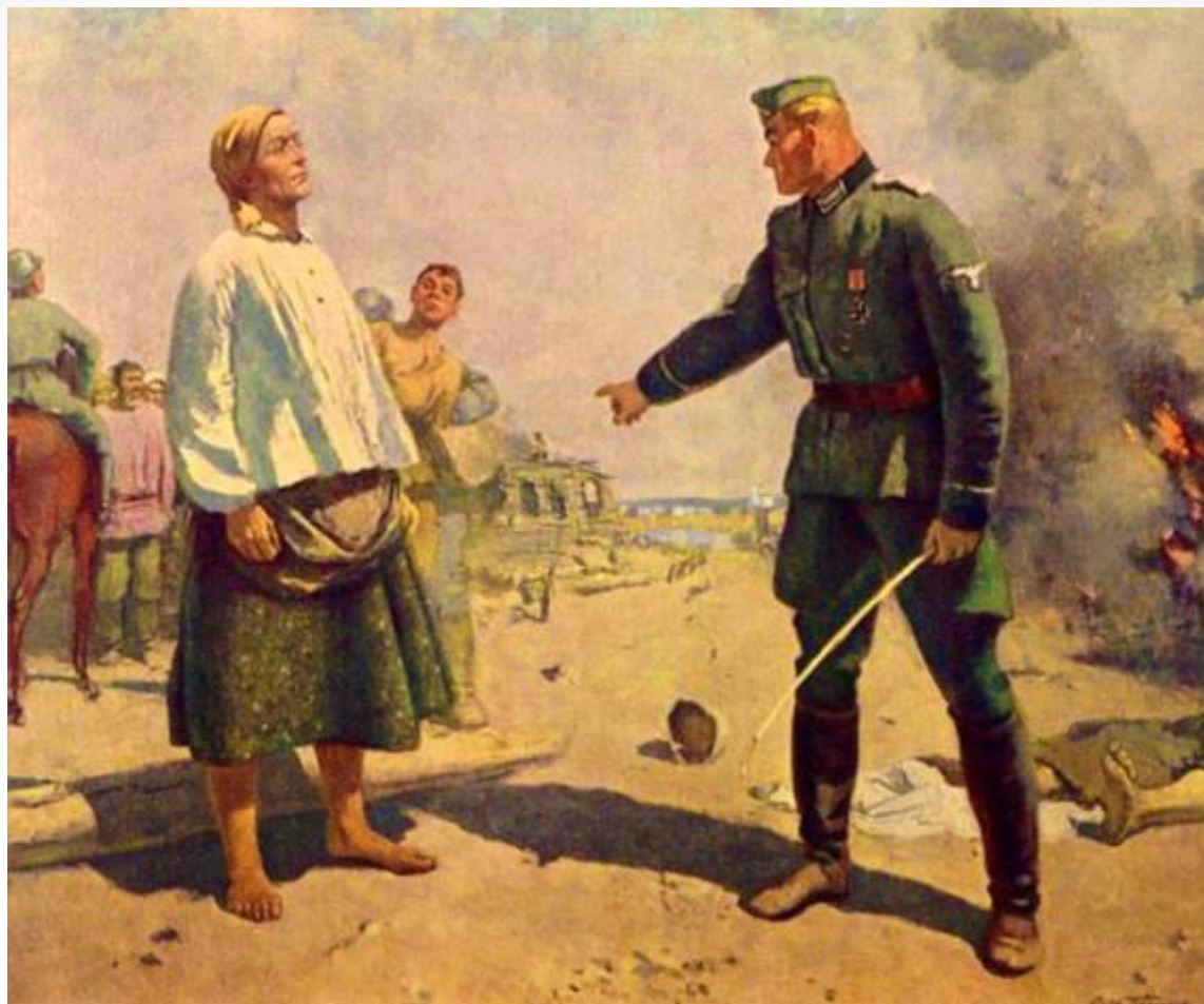
С. Герасимов «Мать партизана» 1943