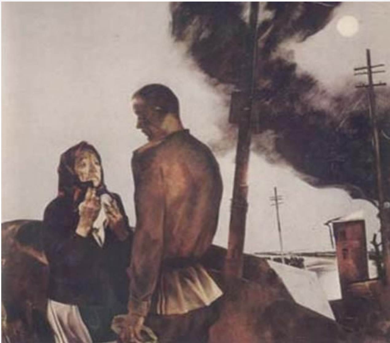
А. Мыльников «Прощание» 1975