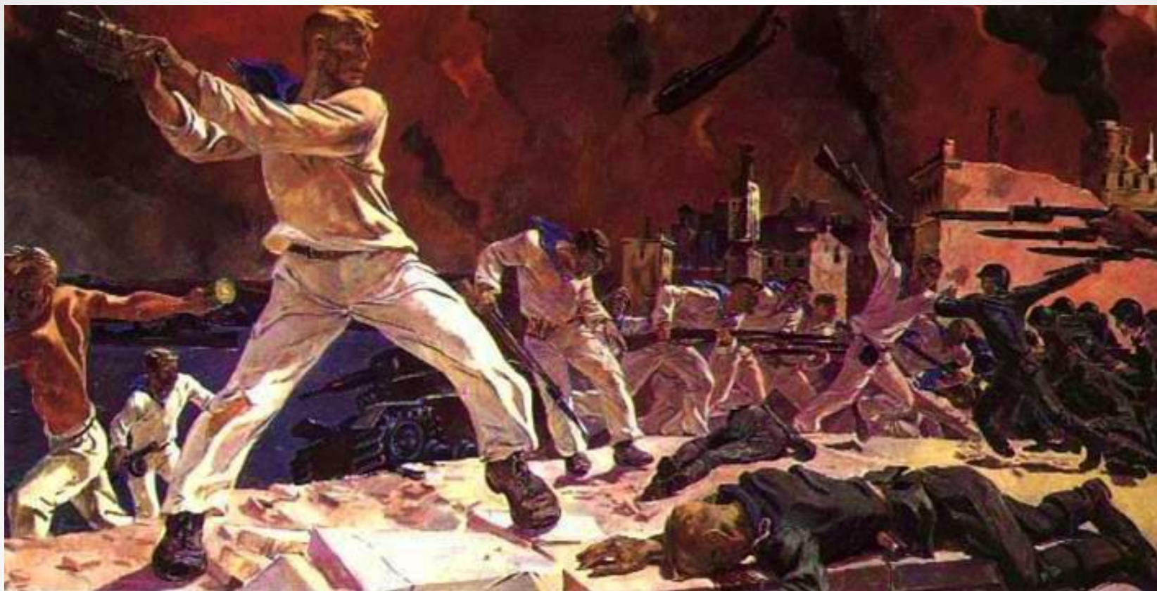
А. Дейнека «Оборона Севастополя» 1942