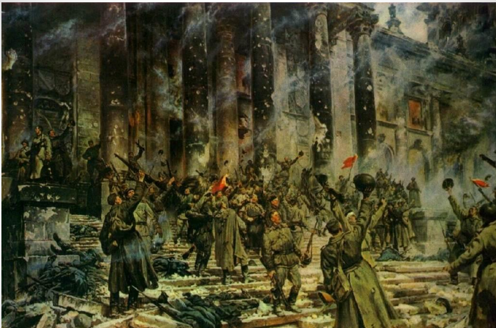
П. Кривоногов «Победа»